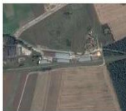
Hale produkcyjne z obiektami magazynowymi i własną kotłownią na biomasę, Nidzica ul. Leśna

Znajdujesz się w: DLA INWESTORA / OFERTY INWESTYCYJNE / NIERUCHOMOŚCI ZABUDOWANE /